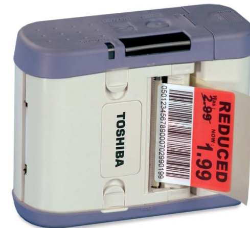
Impression BlueTooth en thermique direct