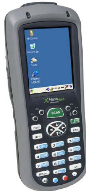
Interface Windows CE ou Windows Mobile