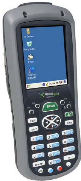
Interface Windows CE